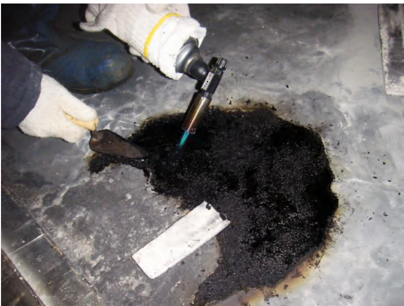
QSバー Lサイズ施工中