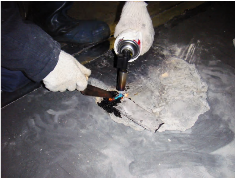
QSバー Lサイズ施工中