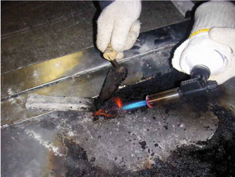
QSバー Sサイズ施工中